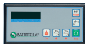
Console comandi Control panel