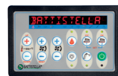
Console comandi Control panel