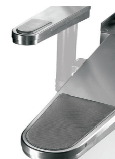
Piano in acciaio inox Stainless steel surface