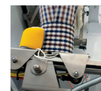
Polso aperto Open cuff