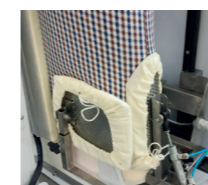
Trazione laterale Lateral traction